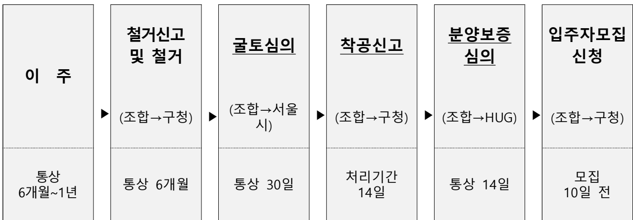
< 관리처분 이후 진행절차 >